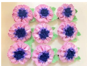
今回作成したコサージュ